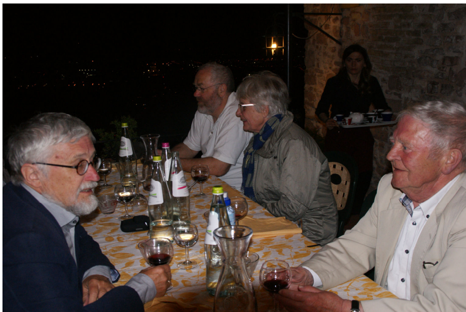
Søndag aften på ristorante Metastasio

som om foråret var kommet til Assisi, så det, kunne vi jo håbe på, var rigtigt.