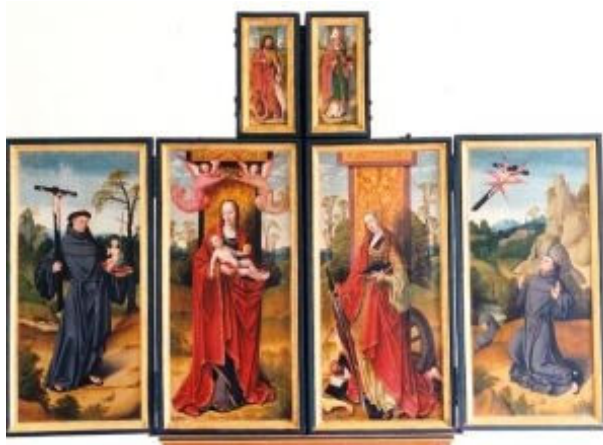
Altartavlen i Ulkebøl Kirke, hvor der på sidefløjene er billeder af Antonius og Frans.