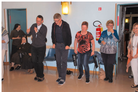
Dans efter søstrenes anvisninger!

for at kabalen kunne gå op for begge parter.