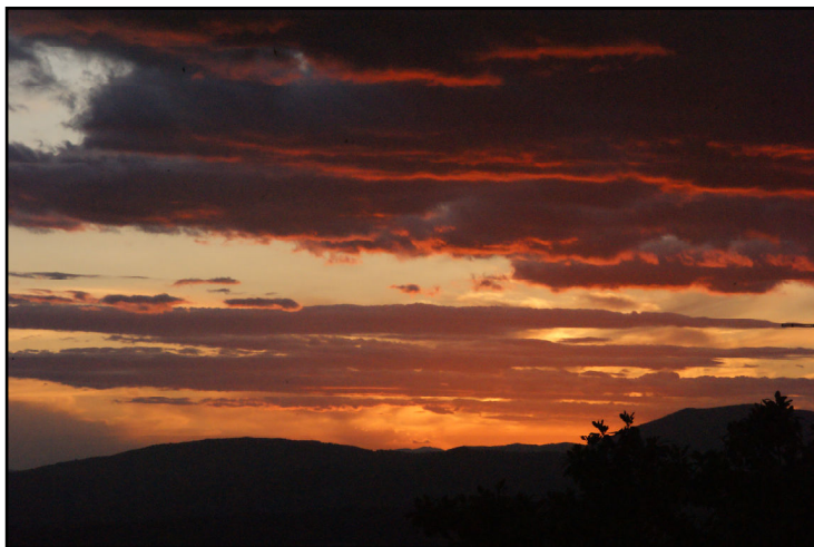
Sådan kan en solnedgang se ud i Assisi!

Efter aftensmad gik vi hen på en restaurant lige i nærheden for en sidste god-nat-drink. Peter holdt en flot lille takketale med fokus på den gode oplevelse, turen havde været for ham som ny deltager.