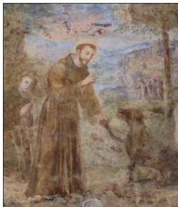
Frans og Ulven fra Gubbio (fresco i klostergården til Santa Chiara- klosteret i Napoli)

Kontingentet kan selvfølgelig som sædvanligt betales kontant ved årsmødet. Ellers betales det ved bankoverførsel til registreringsnummer 3186 konto 2251949.