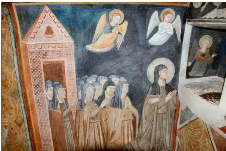
Clara og søstrene. Fresko i San Damiano

Der har Herren ved sin barmhjertighed og nåde på kort tid ladet os vokse i antal, sådan at det, som Herren gennem sin hellige havde forudsagt, skulle gå i opfyldelse.