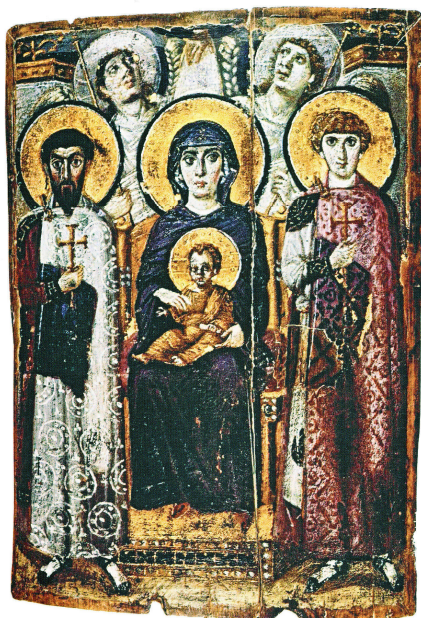
(s 81, Tronende Gudsmoder fra Skt. Katarinaklosteret, Sinai)

Der har været modsatrettede interesser. For kirkefædre og teologerne var det naturligvis vigtigt, at hun (= Maria) var uskyldig og udvalgt, men ligeså væsentligt var det, at hun garanterede Jesu menneskelige side - en kendsgerning, der afspejler sig i udsmykningen af S. Maria Maggiore, der nok fremhæver Maria, men først og fremmest bekræfter inkarnationens realitet. Men samtidigt gjaldt det om at holde fast på, at hun ikke var guddommeligt og slet ikke en ny gudinde. (s. 73-74)