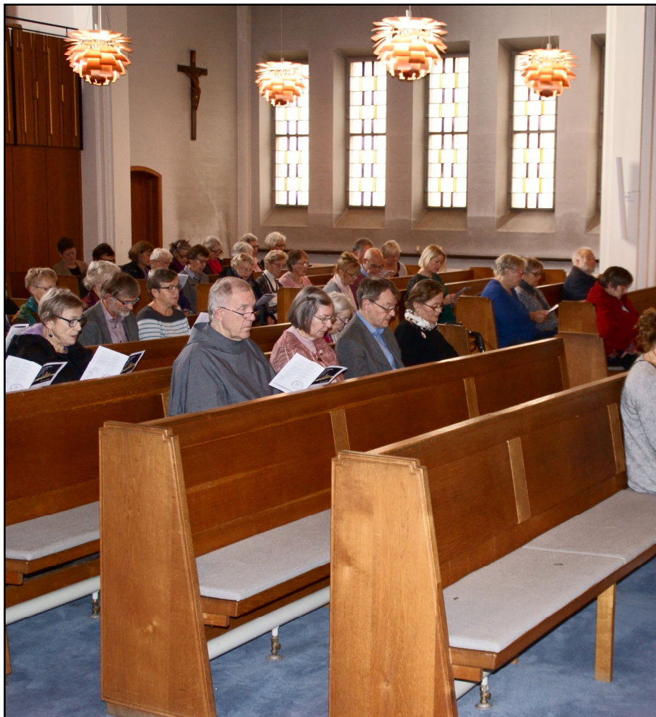
Gudstjeneste ved jubilæumsfesten d. 22. november 2014