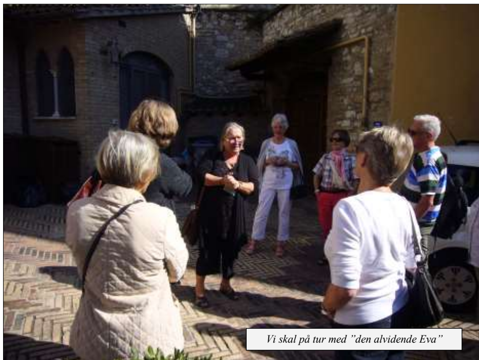
Vi skal på tur med "den altidende Eva"

år 1500. Rædselsvækkende apokalyptiske billeder med Antikrists prædiken, med fortabelsen og med kødets opstandelse. Forvredne kroppe, nogle dødeligt grønne og hvide, mænd i sribede renæssancegasmacher, djævle – alt mesterligt skildret, men gruppvækkende. Nutidens tegneserietegnere må se måbende til.