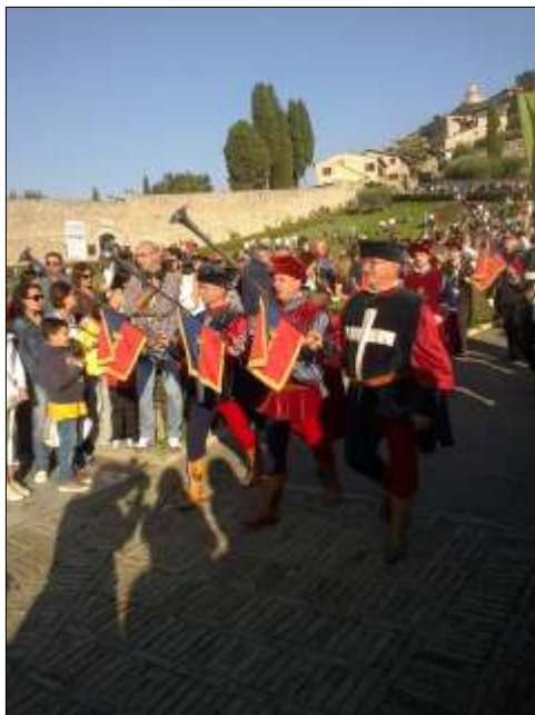
Festivas i anledning af Frans-festen

fresker i domkirken i Orvieto. Pintoricchios underskønne billeder. Bebudelsen med ærkeengel og Maria. Fødslen i