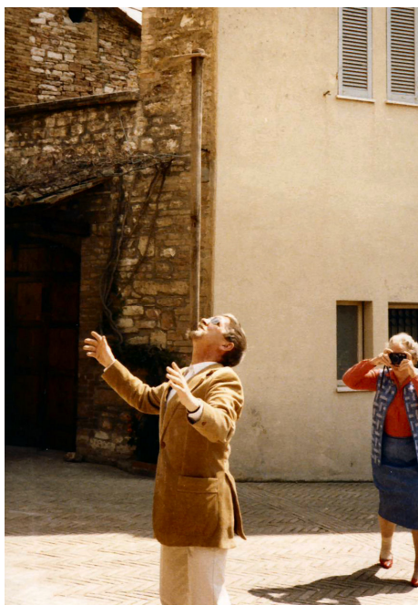
Formanden som balancekunstner