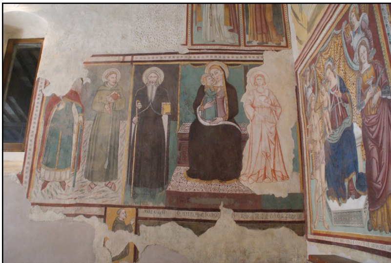
Rocca San Angelo og det lille kloster dér kom til at betyde meget for Johs. Jørgensens åndelige udvikling

Vi var også ved Johannes Jørgensens hus. Det er spændende, at vi har en dansk forfatter, der er så godt kendt i Assisi.