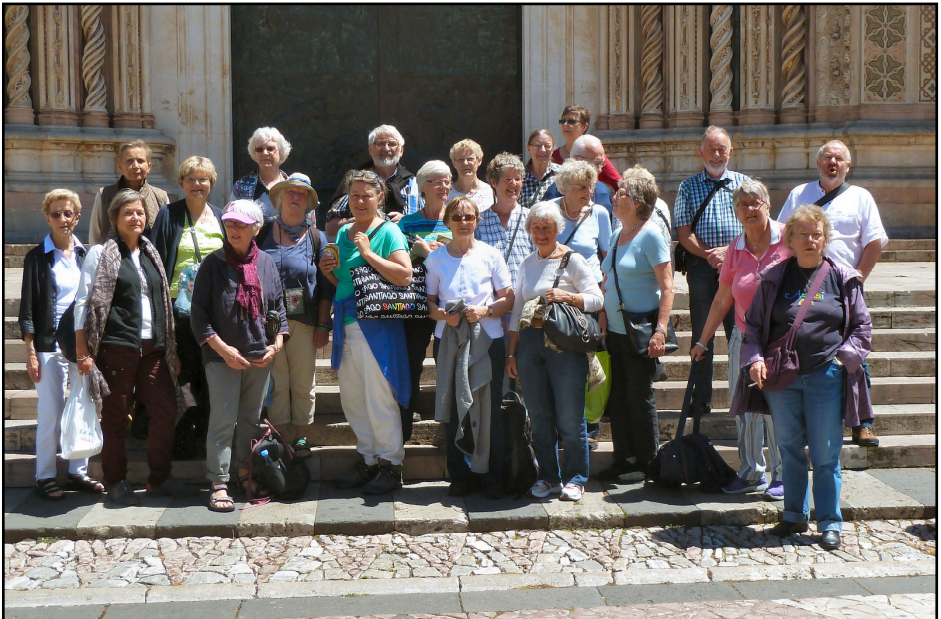
(Det meste af) rejsegruppen på trappen til domkirken i Orvieto