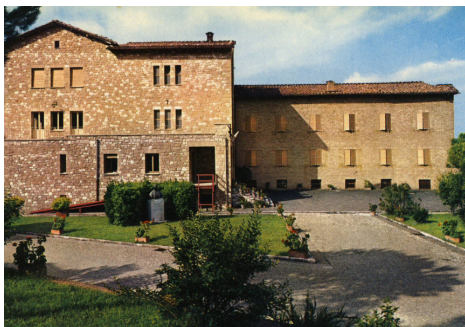
Centro Ecumenico Nordico