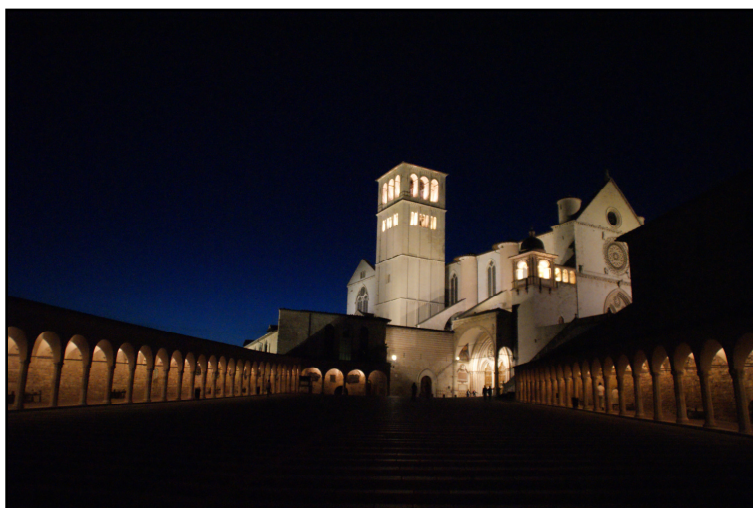
San Francesco by night

Hjemrejsen begyndte umiddelbart efter morgenmaden, for på vej til Rom besøgte vi byen Orvieto. Her så vi den helt unikke