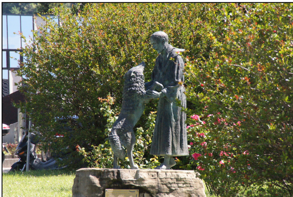
Vi besøgte Gubbio - hvor Fiorettis legende om Frans, der forsoner den blodtørstige ulv med byens beboere, er knyttet.

Det var en dejlig aften, og efter hyggeligt samvær en times tid, gik vi hjem for at sove, så vi kunne blive friske til de følgende dages oplevelser.