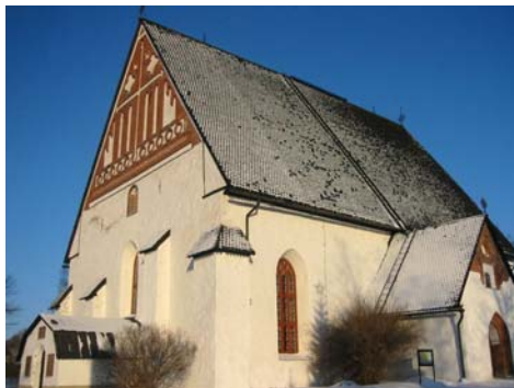
Domkirken i Porvoo (Borgå)

Vi bringer her pressemeddelelsen fra Det mellemkirkelige Råd.: