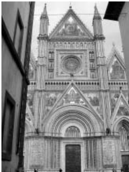
Domkirken i Orvieto