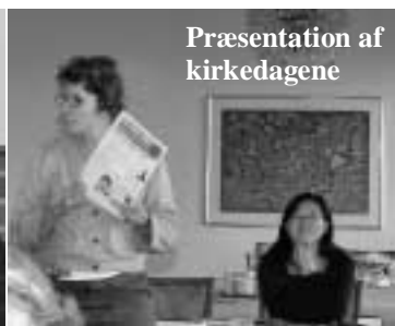
Præsentation af kirkedagene

Danske kirkers Råd og det sammenhørende Mellemkirkeligt Arbejdsforum indbyder hvert år til et økumenisk efterårsmøde på hotel Nyborg Strand med deltagelse fra mange forskellige kirkesamfund og økumenisk engagerede organisationer.