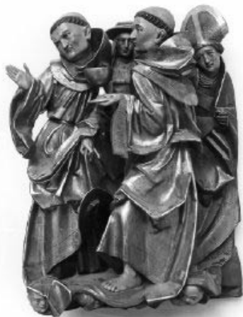
Detalje fra Claus Bergs altertavle