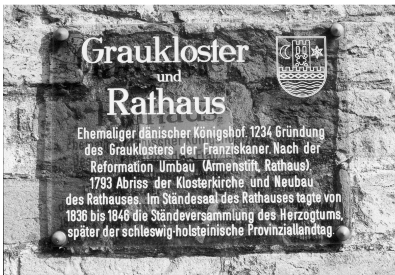
Skilt, som viser at rådhuset i Slesvig har en fortid som gråbrødrekloster

på land. Det stykke jord, hvorpå deres stejle grej lå, fik de til at bygge på.