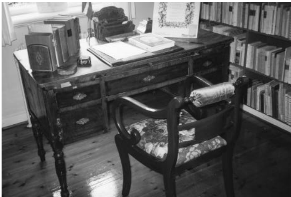
Johannes Jørgensens skrivebord i Svendborg

Gid Johannes Jørgensen havde kendt denne beskrivelse, da han som 15-årig blev sendt til København på eget ansvar. Her skulle den begavede dreng fra provinsen på latinskole. Og det var ikke nogen let sag at være sømandssøn fra Svendborg blandt de "fine" københavnske embedsmandssønner. Selv beskriver han sin situation således: